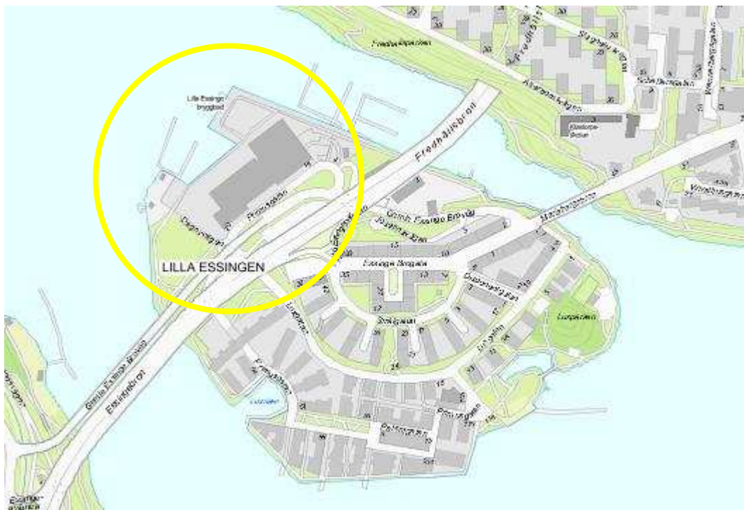
Översiktskarta med planområdets ungefärliga läge markerat.