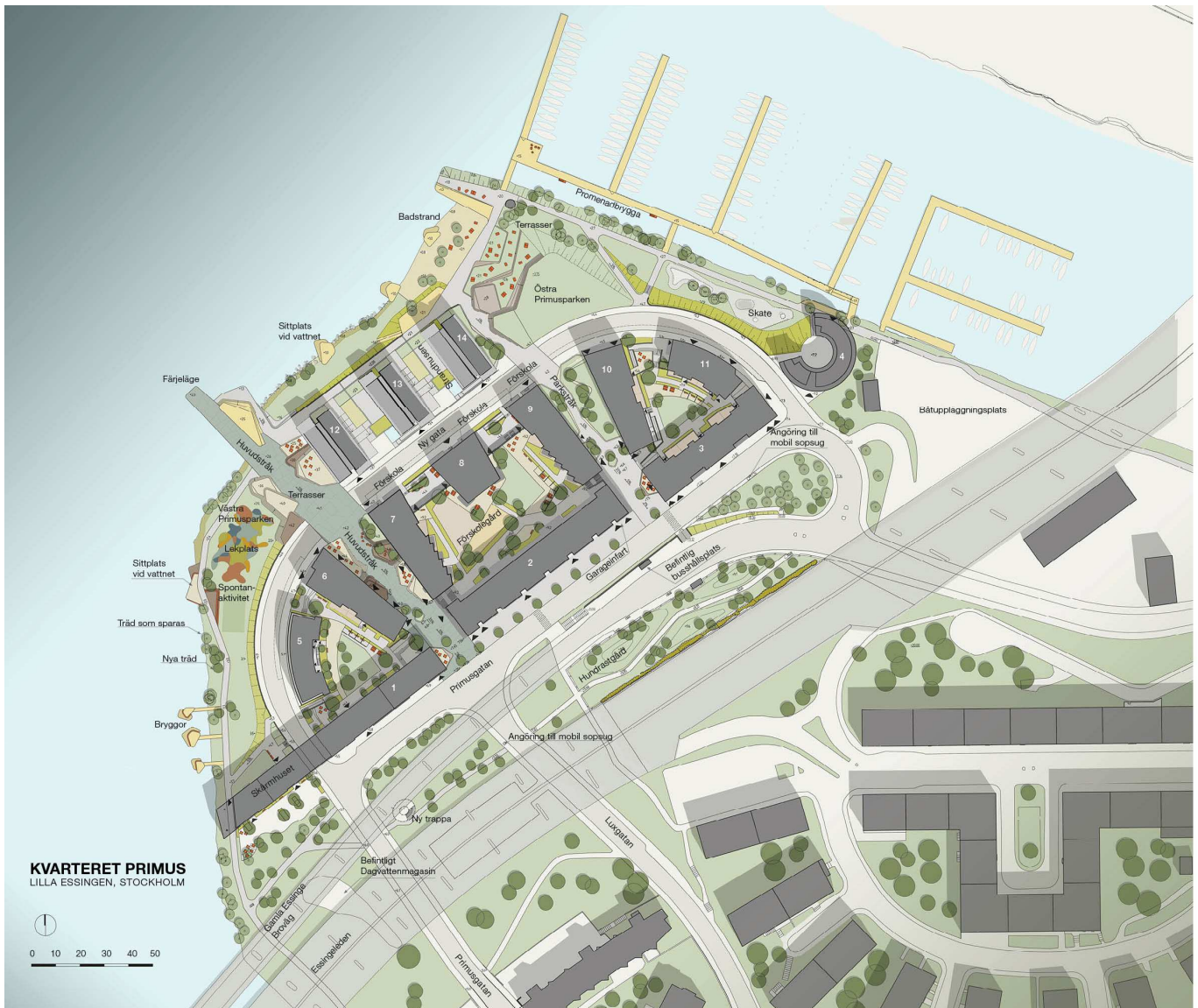
Situationsplanen över Primusområdet.

Detaljplanen syftar till att möjliggöra ny markanvändning för nya bostäder med lokaler för publikt ändamål på Lilla Essingens nordvästra del – Primusområdet. Planen ska fullfölja intentionerna som anges i Promenadstaden - översiktsplan för Stockholm för att skapa en attraktiv stadsmiljö och bättre möjligheter till rekreation vid stadens vatten. Totalt tillförs området 600 lägenheter (lgh) varav ca 210 lgh på stadens mark och ca 390 lgh på privatmark.